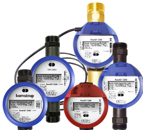
flowIQ® 2200 mérőcsalád

Fontos: a jövőben a tömítést a csatlakozó idomhoz külön kell rendelni.