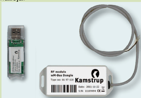
wM-Bus Dongle + USB eszköz

1221 Budapest, Jobbágy u. 5. info@comptech-kft.hu ☎ : (1) 226-1585 www.multical.hu