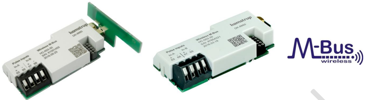
vezetéknélküli M-Bus modul 3-30

Milyen szempontokat vegyünk figyelembe vezeték nélküli M-Bus (wireless M-Bus) modul kiválasztásánál/rendelésénél MULTICAL® 403 és 603 esetén.