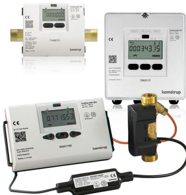
kamstrup 3. generációs mérőeszközök & ULTRAFLOW® 44 (hűtésre)