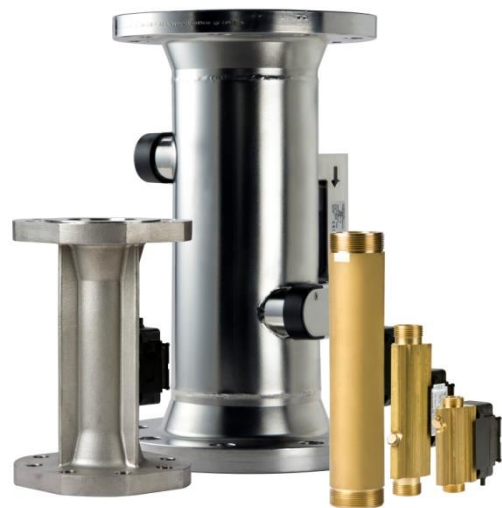
ULTRAFLOW® 34/54 család qp=0,6 - 1000 m 3 /h méréstartományban

Kiadva: 2020. március 3. Módosítva: 2020. augusztus 14.