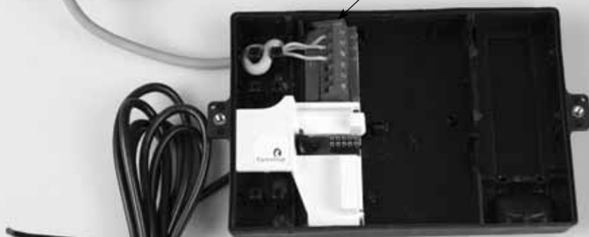
Water meter base