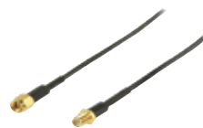
5000 429: 5 m 5000 441: 10 m 5000 442: 15 m 5000 443: 20 m 5000 444: 25 m