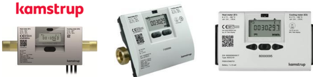
2013 • MULTICAL 302

Okos mérést támogató ultrahangos hőmennyiségmérők új generációja: